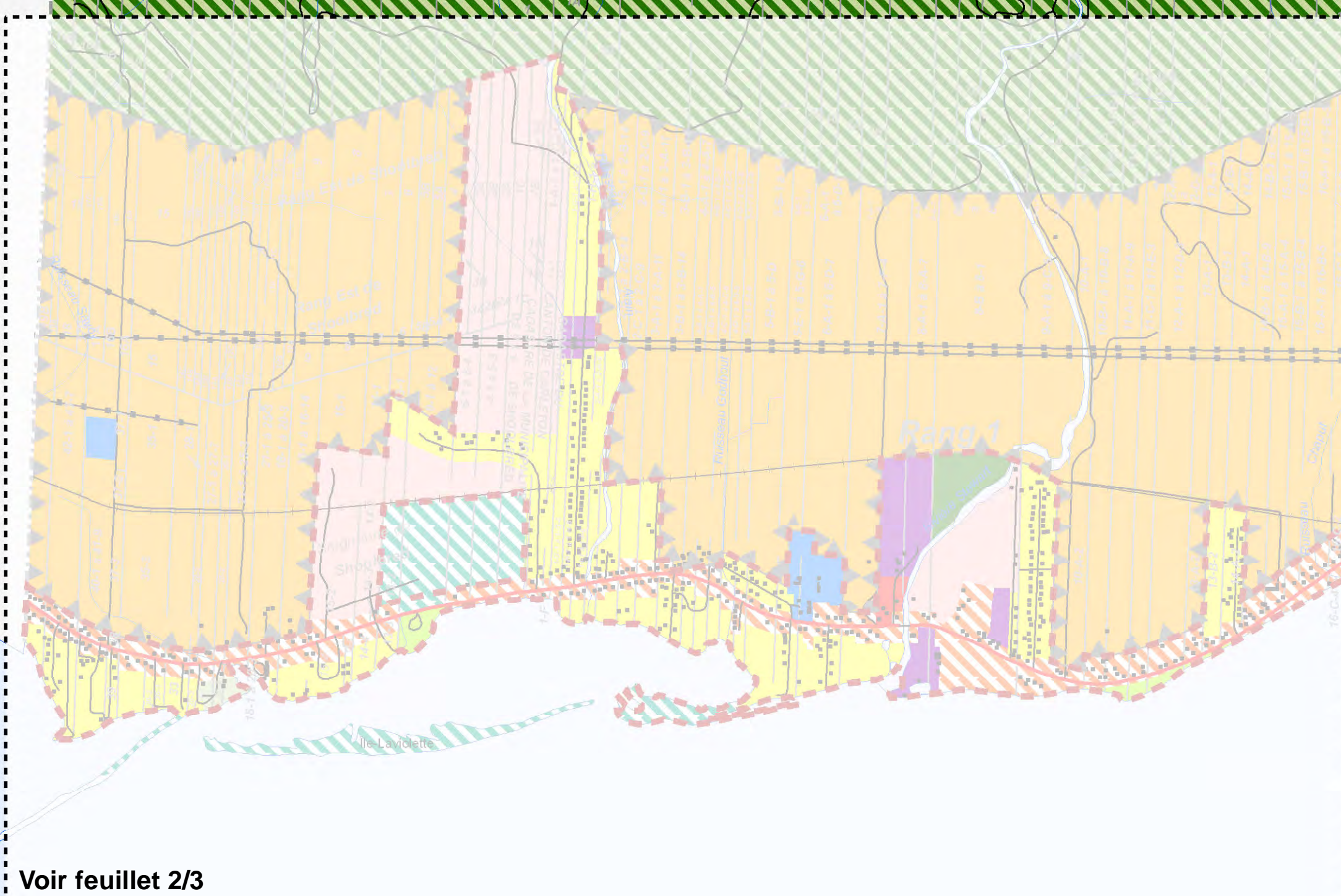
Voir feuillet 2/3