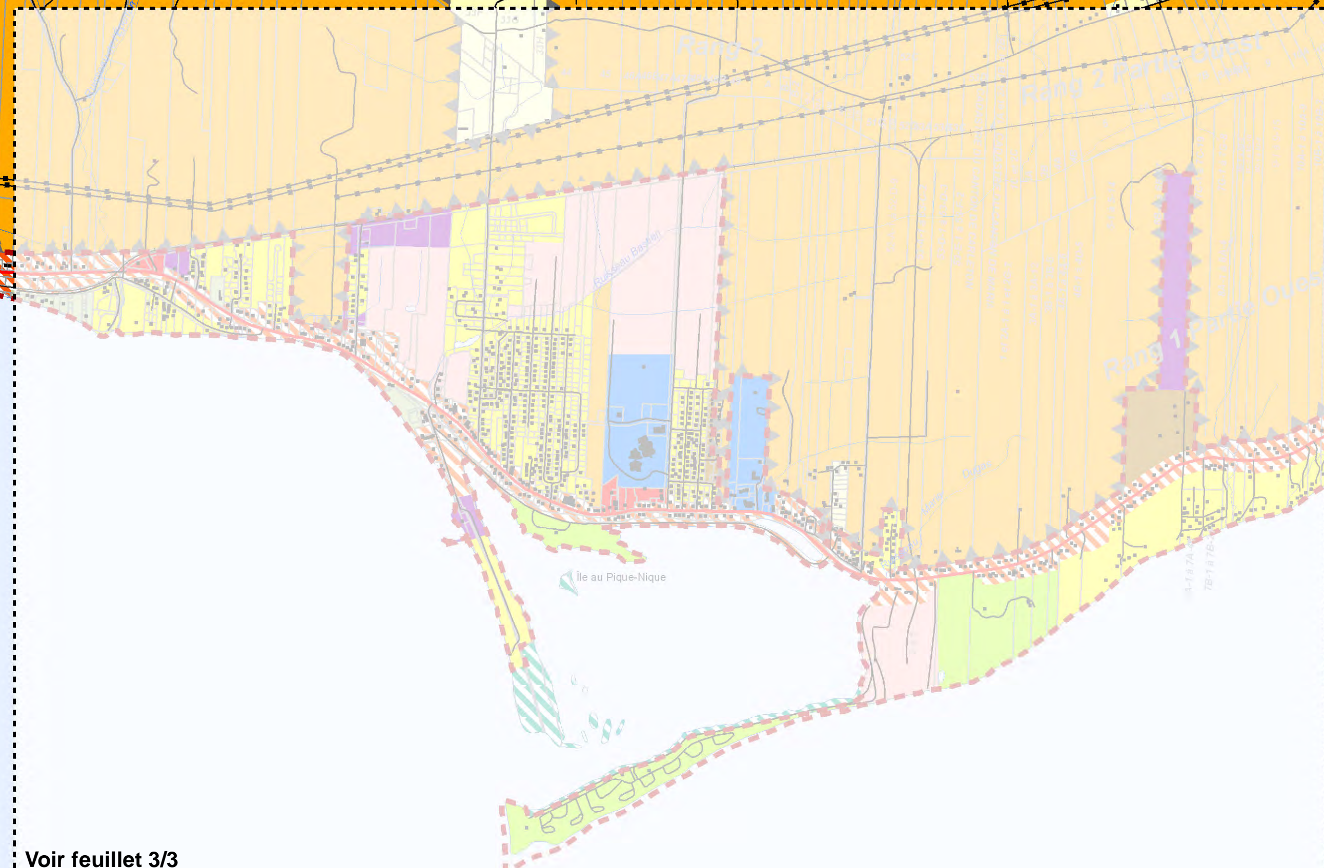
Voir feuillet 3/3