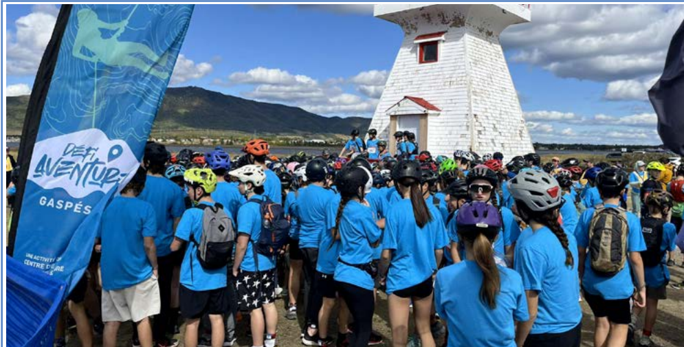
Le 19 septembre dernier, plus de 250 jeunes ont pris le départ du 5 e Défi Aventure Gaspésie à Carleton-sur-Mer, une course d'aventure et d'orientation.