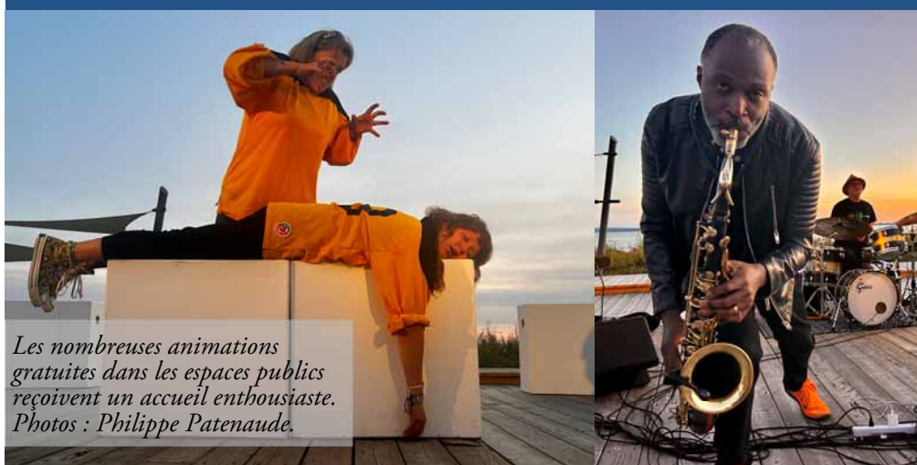
Les nombreuses animations gratuites dans les espaces publics reçoivent un accueil enthousiaste.