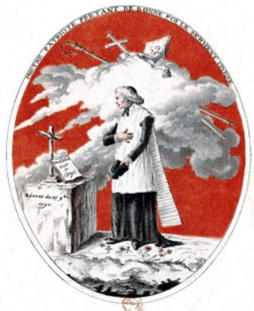
PRETRE PATRIOTE prestant de bonne foi le serment civique.