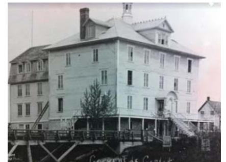
En 1903, le couvent des Sœurs de la Charité de Carleton est agrandi et abrite une chapelle, une salle de récréation, un réfectoire et un dortoir.