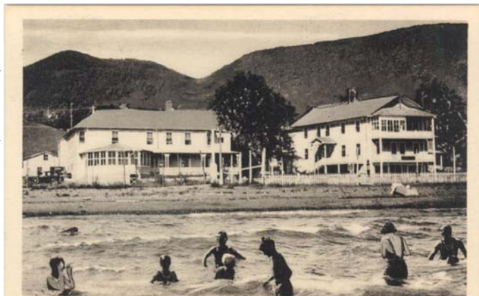
Wilfred Hôtel, F. L. Cullen, Prop., Route 6, Carleton-sur-Mer, Québec.

La baignade était populaire devant le célèbre hôtel Wilfred.