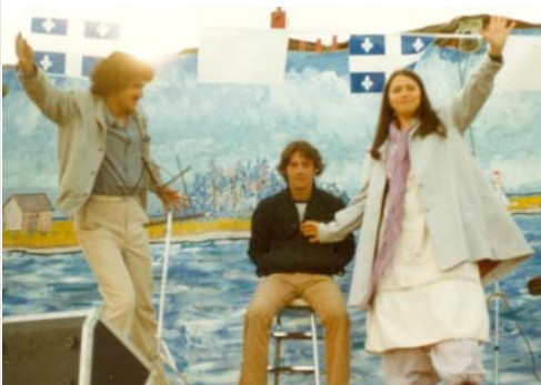
Le groupe Tracadieche a célébré les fêtes de la Saint-Jean à Carleton en 1981.