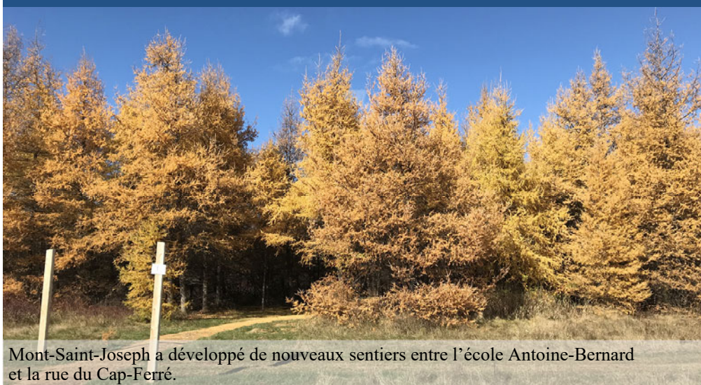
Mont-Saint-Joseph a développé de nouveaux sentiers entre l'école Antoine-Bernard et la rue du Cap-Ferré.