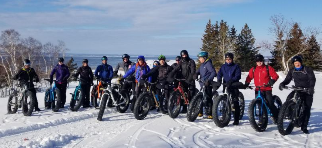
Volume 40, numéro 3, mars 2020

Une quinzaine de personnes ont pu découvrir ou redécouvrir les sentiers de fatbike dans des conditions idéales au golf le 8 mars dernier, lors d'un rassemblement amical ouvert à tous.