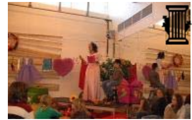
THÉÂTRE Le Clan Destin

Le Clan Destin termine son 40 e anniversaire de façon fantaisiste avec un événement familial gratuit au Quai des arts! Des enfants et des parents vous raconteront des histoires de flocons et de rêves enneigés.