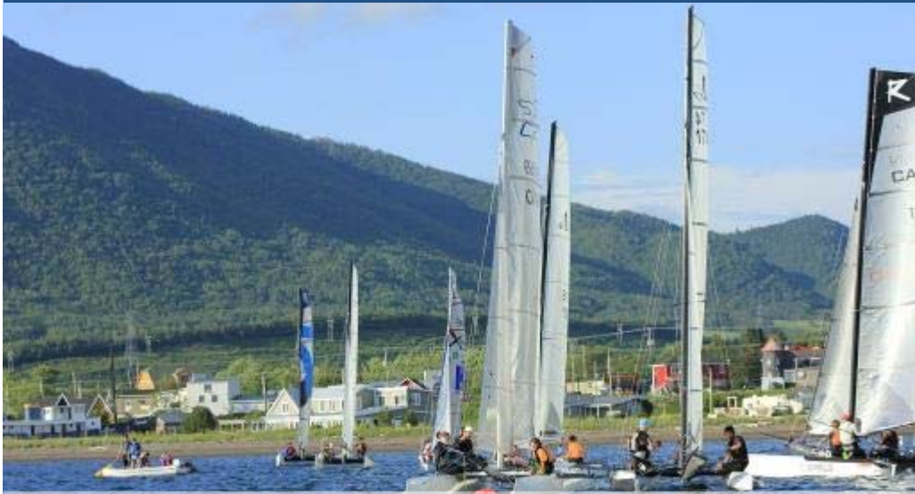
Les 6 e Régates Écovoile Desjardins se tiennent les 19, 20 et 21 juillet.