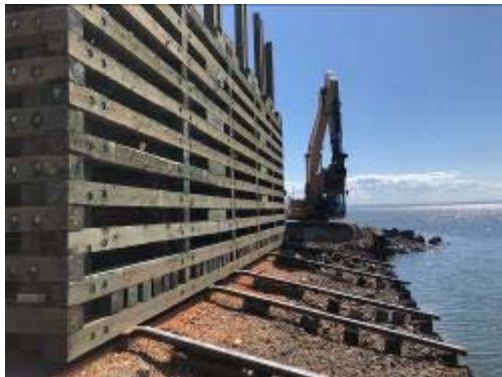
Un des quatre encaissements de bois qui sont installés pour la section de pêche au maquereau.