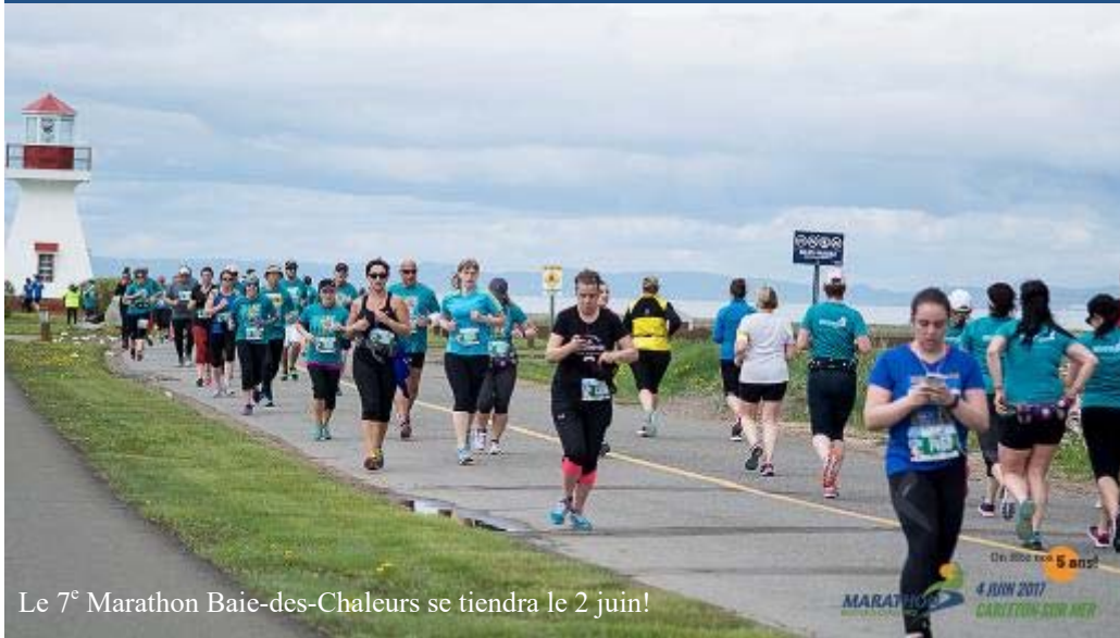
Le 7 e Marathon Baie-des-Chaleurs se tiendra le 2 juin!