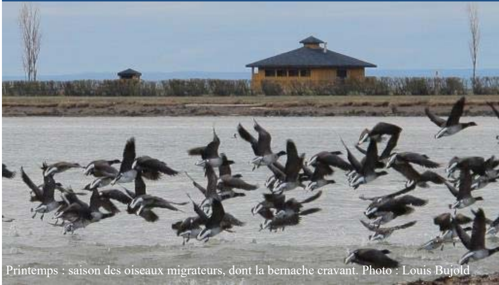
Printemps : saison des oiseaux migrateurs, dont la bernache cravant.