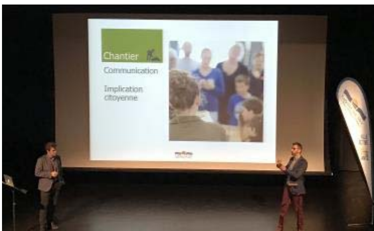
Le budget participatif est un projet qui s'inscrit dans un des chantiers de la planification stratégique présentée à la communauté en décembre dernier.

Comme première action, ce chantier convoque les gens de la communauté d'affaires à réfléchir sur les meilleures façons de répondre aux besoins exprimés.