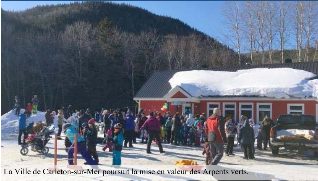
La Ville de Carleton-sur-Mer poursuit la mise en valeur des Arpents verts.