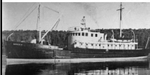
Le St-Barnabé, alors qu'il portait le nom de Ranger II, était en service sur les Grands Lacs.