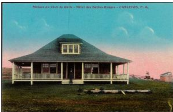
Le chalet du club de golf, construit en 1928, sera déménagé près du quai pour servir de chalet au club nautique de Carleton.