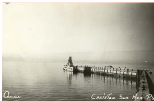
La célèbre photo du remorqueur Madawaska amarré au quai de Carleton-sur-Mer

Saviez-vous que, en octobre 1928, le moulin de la Madawaska est arrivé à Carleton en pièces détachées sur un convoi de 19 charrs de fret en provenance de Keegan, dans le Maine? L'aventure gaspésienne d'Édouard Lacroix débute en 1926, alors qu'il achète un territoire de 232 000 mi 2 de forêt près de Causapschal, où il installe un moulin. L'année suivante, Édouard Lacroix cherche un site propice dans la Baie-des-Chaleurs pour implanter un nouveau moulin. Sur la grève à Carleton, il remarque que les marées montantes exercent une poussée vers l'intérieur du barachois. Convaincu d'avoir trouvé le site idéal, le 14 avril 1928, il crée la compagnie Madawaska Corporation et achète les terrains. Dès l'été, il commence le démantèlement de l'un de ses trois moulins de Keegan qu'il achemine vers Carleton. En 1928-1929, la compagnie fait couper 23 millions de pieds de bois dans le secteur de Causapschal qui sont dravés vers Carleton aux fins d'approvisionnement. À